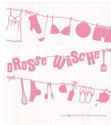
GROSSE WÄSCHE Nr. 820048