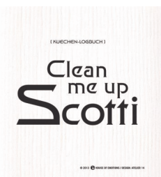
CLEAN ME UP ... Nr. 920032