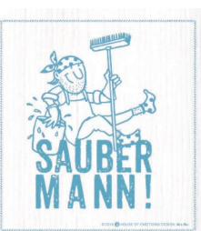
SAUBERMANN Nr. 820186