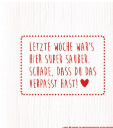
LETZTE WOCHE Nr. 720099