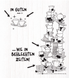
IN GUTEN, WIE IN Nr. 820131