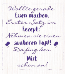
WOLLTE GERADE Nr. 820115