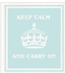
KEEP CALM MINT Nr. 026738