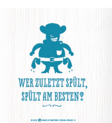
WER ZULETZT ... Nr. 920084