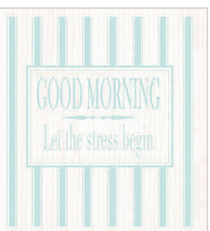
GOOD MORNING Nr. 026739