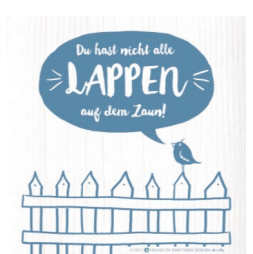
LAPPEN ZAUN Nr. 820142