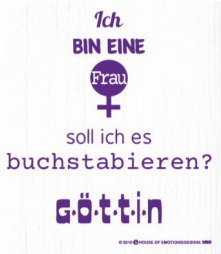
GÖTTIN Nr. 020097