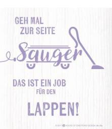
SAUGER Nr. 820143