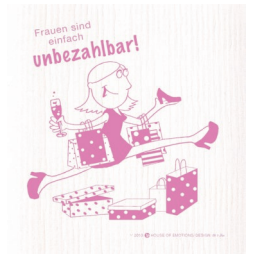
FRAUEN SIND ... Nr. 820019