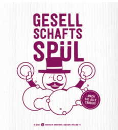
GESELLSCHAFTSSPÜL Nr. 920169