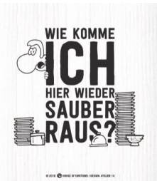
WIE KOMME ICH... Nr. 920112