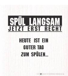
SPÜLLANGSAM Nr. 820079