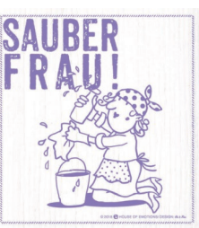
SAUBERFRAU Nr. 820185