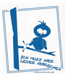
ABBRECHEN Nr. 020082