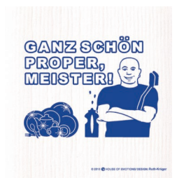
SCHÖN PROPER Nr. 720025