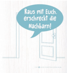
NACHBARN Nr. 820167