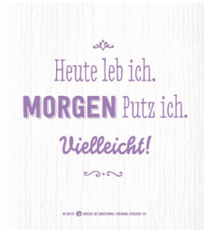
HEUTE LEB ... Nr. 920088