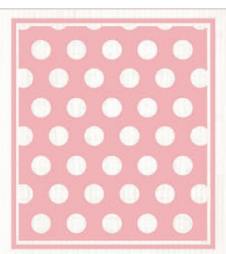
PÜNKCHEN ROSA Nr. 024540