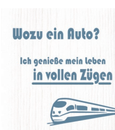
IN VOLLEN ZÜGEN Nr. 020189