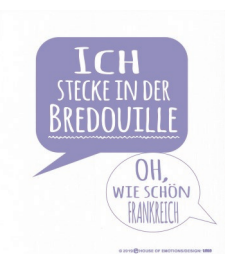
BREDOUILLE Nr. 020194