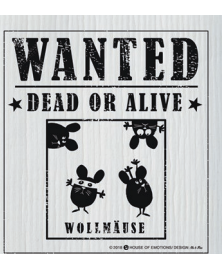
WOLLMÄUSE Nr. 820184