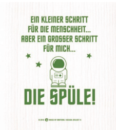
EIN KLEINER SCHRITT Nr. 920113