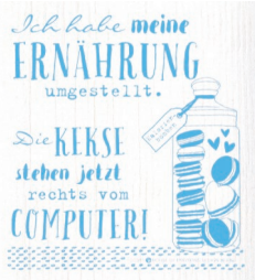
ERNÄHRUNG Nr. 820101