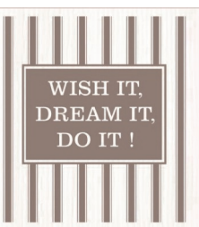
WISH IT ... Nr. 029044