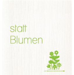
STATT BLUMEN Nr. 020124