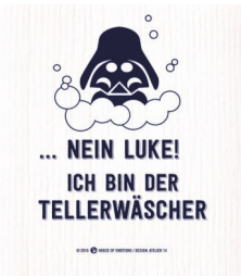
NEIN LUKE! Nr. 920110