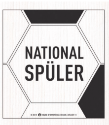
NATIONAL ... Nr. 920064