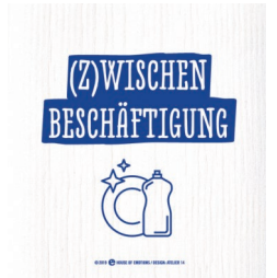
ZWISCHEN- BESCHÄFTIGUNG Nr. 920175