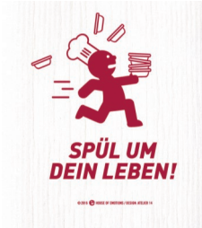
SPÜL UM .... Nr. 920111